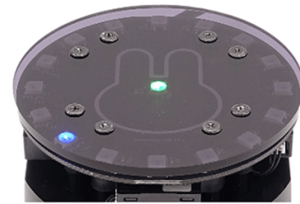
風向風速IoTセンサー「anemolink®-2D」