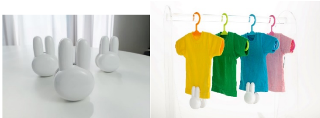
洗濯乾燥IoTセンサー「乾送ミミダス®」